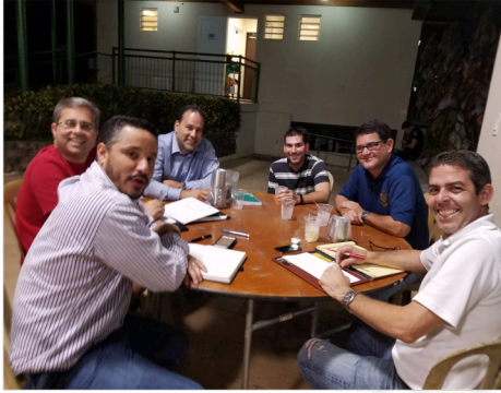
Reunión de Directiva del Pepín Villares