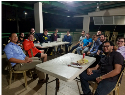
Reunión Capitular del Capítulo Alpha