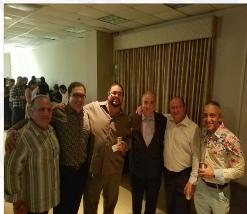
Ea, ¡alto poder!