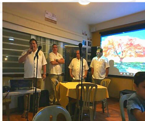
Presentación del Fideicomiso del Centenario en la Hacienda Phi Eta Mu