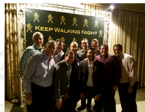
¡El Pelayo presente!