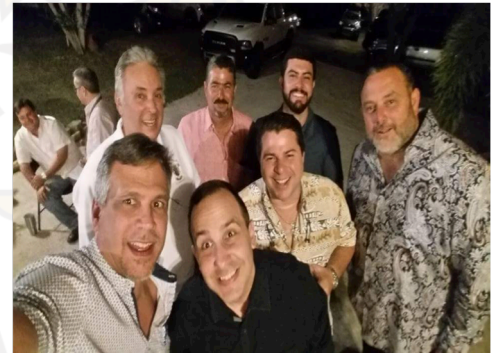
Smoker del 60 Aniversario Omicron