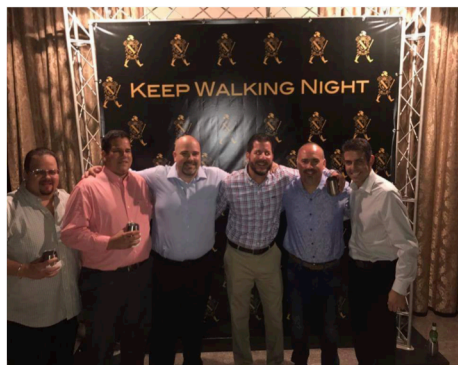
From the West